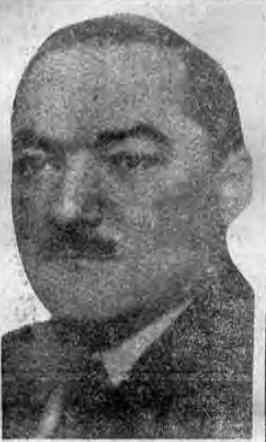
El periodista germanófilo M. Marcel Deat, quien fué herido en Versalles cuando el atentado contra M. Pierre Laval, ex primer ministro francés, hechos que son el producto de la reacción que se está operando en Francia, contra la ocupación alemana. M. Deat es también ex ministro del aire, y recibió una herida en el brazo izquierdo.

HAY MUCHOS NAZI-FASCISTAS QUE PRETENDEN SER AMIGOS DEL GOBIERNO PARA COGER PUESTOS DE MANO