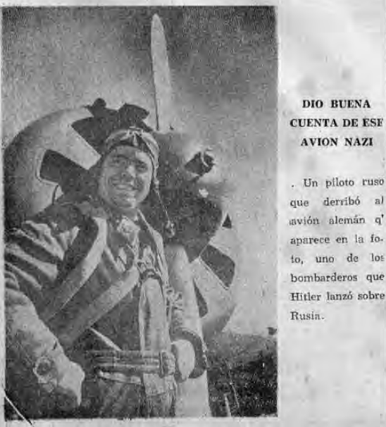
DIO BUENA CUENTA DE ESE AVION NAZI