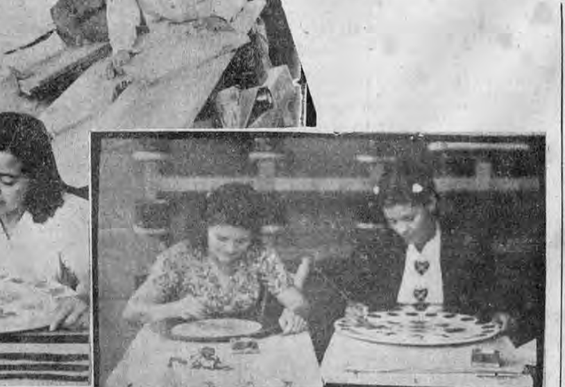
abajo: dos señoritas en el decorado.

"LA TRIBUNA" CUENTA A SUS LECTORES COMO SE FABRICAN EN NUESTRO PAIS OBJETOS DE MADERA CON EL SISTEMA DE PINTURA — GOTEADO— QUE SIMULA EL TEJIDO INDIGENA MAYA