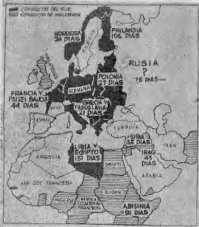
El mapa del Viejo Mundo a los dos años de la guerra

LA TRIBUNA suministra una breve sinopsis de los acontecimientos desarrollados desde setiembre del 39 hasta setiembre del 41